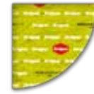
GORGONZOLA DOP BIO 1/8 FORMA