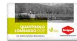
QUARTIROLO LOMBARDO DOP BIO 1/2 FORMA