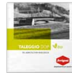
TALEGGIO DOP BIO FORMA