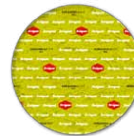
GORGONZOLA DOP BIO FORMA

STAGIONATURA Minimo 50 giorni AGEING 50 days minimum